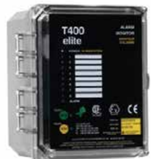
T400 NTC Elite