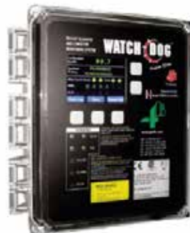
Watchdog Super Elite WDC4