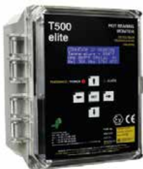
T500 Hotbus Elite

Los sensores de temperatura pueden utilizarse con los siguientes monitores de control: